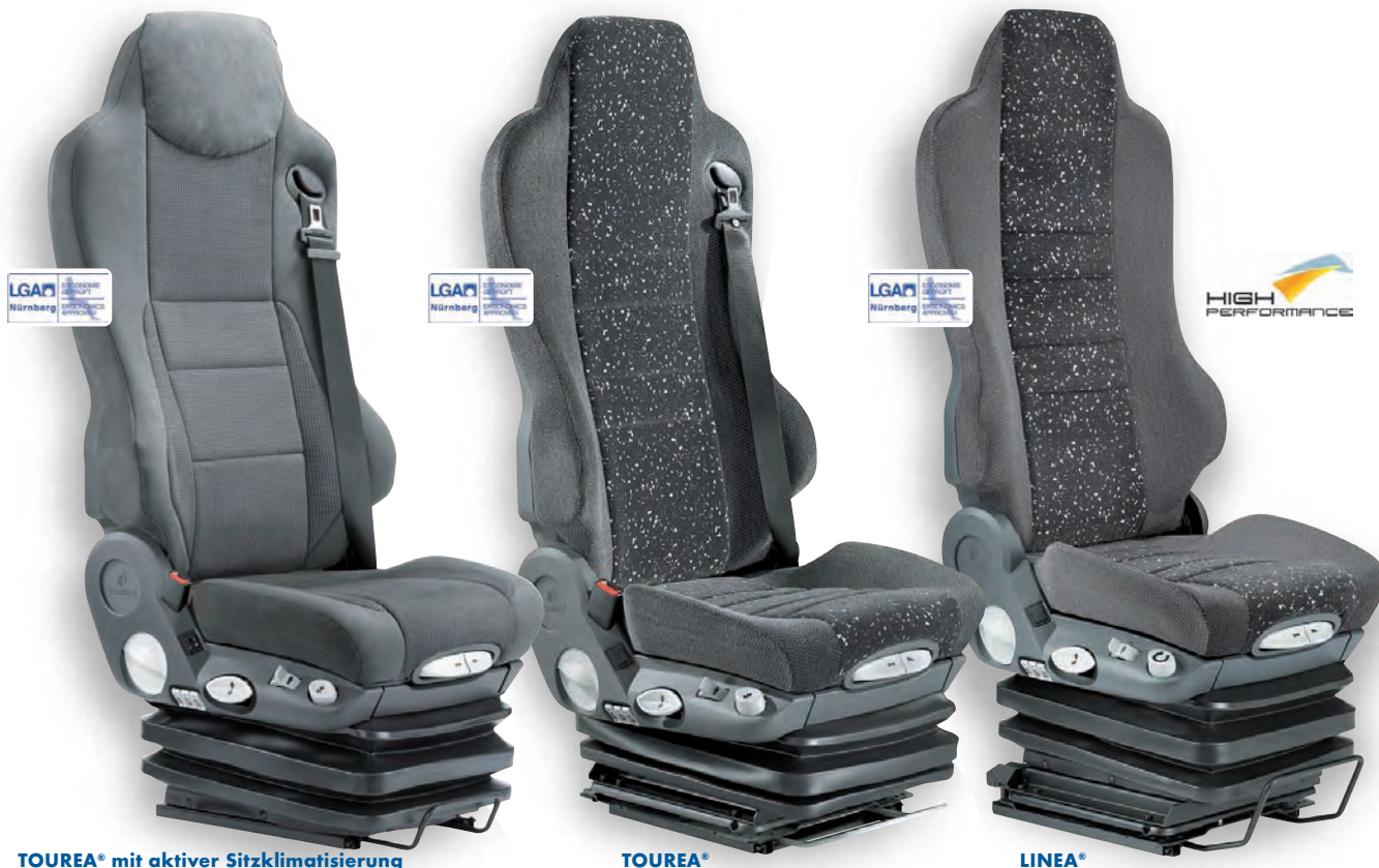
TOUREA® mit aktiver Sitzklimatisierung